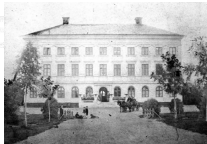
Axmar Slott byggdes 1861

Järnslottet ska bli unikt i sitt slag och med de möjligheter till olika evenemang och möten som kan anordnas i dess väldiga rymd skulle det bli en starkt bidragande faktor till den fortsatta utvecklingen av Axmar bruk som både ort och besöksmål. Det ska öppna upp för upplevelser som knyter an till Axmar bruks historia, kultur och natur och på ett nytt och intressant sätt väcka intresset för detta hos en yngre publik.