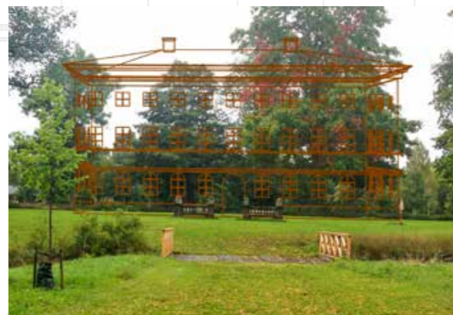
Järnslottet - en unik vision som kan bli verklighet